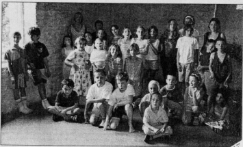
Théâtre, mime, création de masques en plâtre pour ces stagiaires.