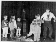
Les enfants des écoles maternelles ont pu assister à un superbe spectacle.

Organisé par le comité municipal des fêtes, les enfants des écoles maternelles de la commune ont pu assister salle Agora, à un superbe spectacle : "Les Chapeaux enchantés" interprété par la compagnie Émeline de Saint-Péray : 5 chapeaux pour 5 histoires mêlées, sur un fond musical et avec la participa-