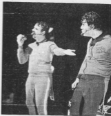
■ De Nico... à Roger.

Attention : places à réserver au 04 78 81 01 20.