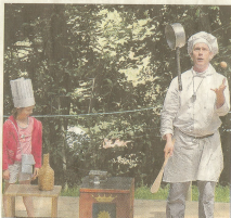
Véritable succès populaire, la fête de la musique et des jeux a lieu ce samedi 13 juin.

Et pour terminer cette journée de fête, le grand show musical de la place de l'Hôtel de Ville débutera à 20h30 avec, en 1ère partie, le groupe français de rock Eye n' Sea (chansons en anglais) et en 2ème partie, le groupe Five enflammera la scène avec ses reprises des mythiques Pink Floyd... □