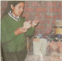
Saint-Péray accueille la 8 e édition d'«Histoires d'Amérique Latine» jusqu'au 21 février.

J usqu'au 21 février, Saint-Péray accueille la 8 e édition d'«Histoires d'Amérique Latine» en partenariat avec l'office de tourisme du Pays de Crussol, La Cacharde et les associations Ayllu et Partage sans frontières.