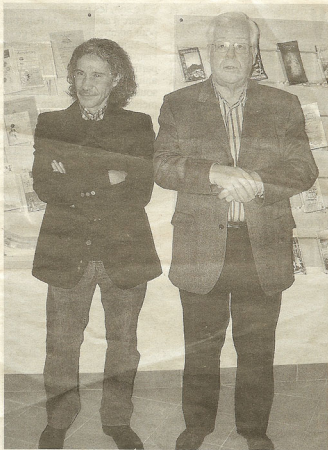
Mémo Labastida Recu expose à l'office du tourisme.

Au même endroit, le 31 janvier à 20 h 30 le groupe La Machete produira un spectacle de « musique afro-péruvienne ». Le lendemain 1er février à 16 h 30, la place sera au cinéma mexicain « El Violin » de Francisco Vargas. Et le mercredi sera réservé aux enfants avec un spectacle jeune public « La différence est égal » par la compagnie Zinzoline et la compagnie Les mains animées (4 février à 15 h). La bibliothèque proposera une exposition de reproduction de Frida Khalo du 31 janvier au 5 février et un