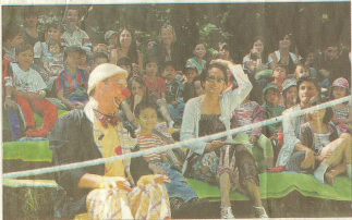
Le clown dans son élément, au milieu d'un public acquis à sa cause, le rit.

C e 7 e festival de l'enfance de l'art, devenu une manifestation incontournable pour les jeunes Saint-Pérolais, n'a pas failli à la tradition cette année en offrant toujours des spectacles pleins de fantaisie et d'originalité au public.