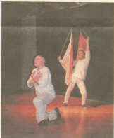
Les rencontres s'effectuent à travers la présentation de spectacles. ©

www.cloisinclois.org . Public de 3 à 14 ans. Journée tout public le mercredi 10 juin de 10 heures à 18h30. Pass journée à 10 € et demi-journée à 7 €.