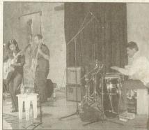
Le groupe "La Machete" dans la salle de concert de La Cacharde.

POUR EN SAVOIR PLUS www.myspace.com/lamachete