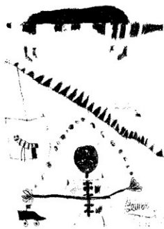
Dessin primé en 2004