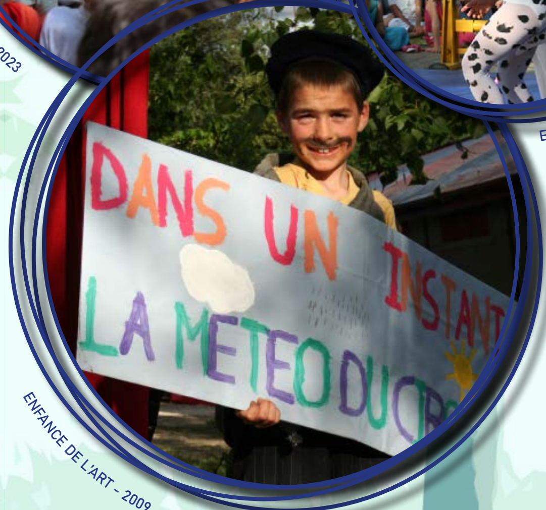
ENFANCE DE L'ART - 2009