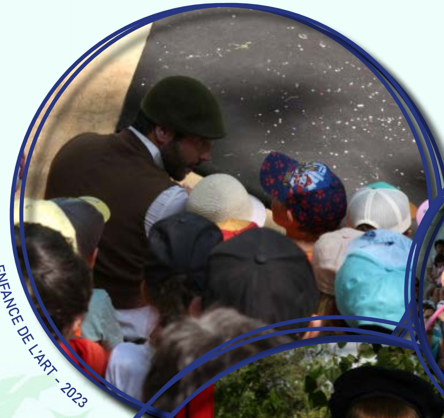
ENFANCE DE L'ART - 2023

10 - Le développement de l'éducation artistique et culturelle doit faire l'objet de travaux de recherche et d'évaluation permettant de cerner l'impact des actions, d'en améliorer la qualité et d'encourager les démarches innovantes.