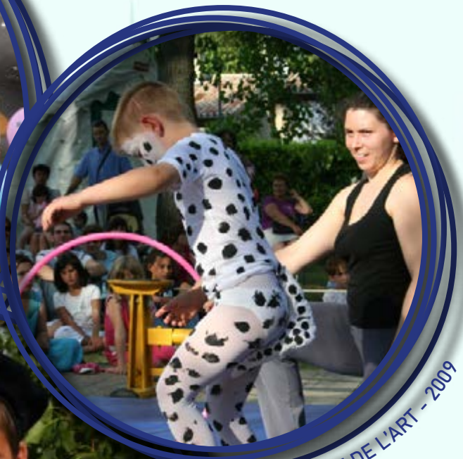
ENFANCE DE L'ART - 2009